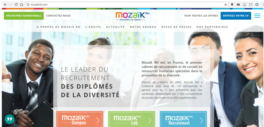
Figure 5 : « Mozaïk RH : diversifiez vos talents / Le leader du recrutement des diplômés de la diversité »

Nous repérons des formes sémiotiques récurrentes dans les visuels qui accompagnent la thématique de « la diversité ». Il s'agit principalement du format « trombinoscope » (ou mosaïque de portraits), parfois couplé avec différentes formes multicolores plus ou moins figuratives 20 .